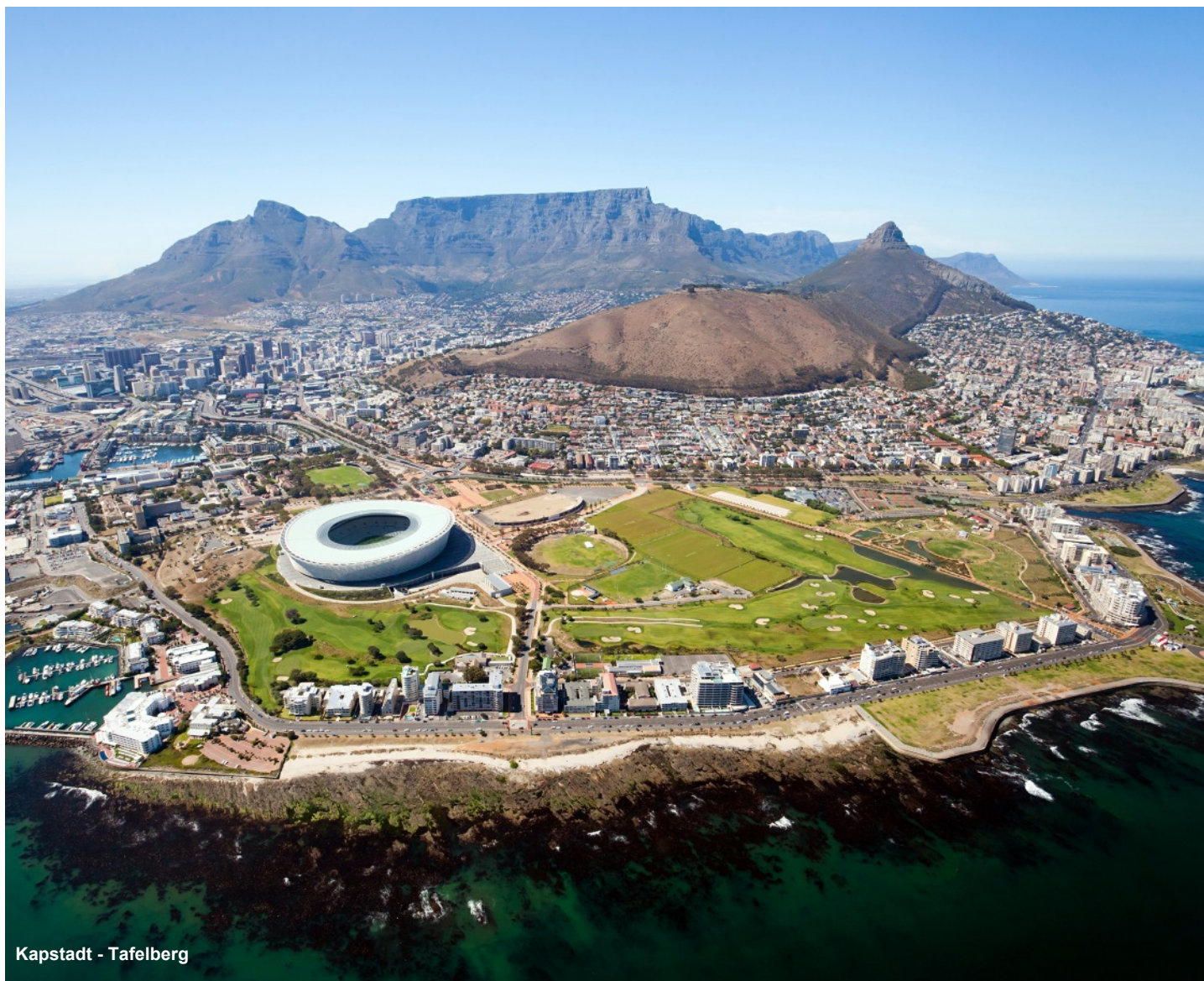
Kapstadt - Tafelberg

„Vom Krüger - Nationalpark zum Kap der Guten Hoffnung“