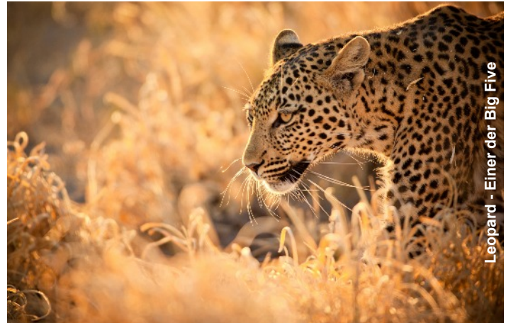
Leopard - Einer der Big Five