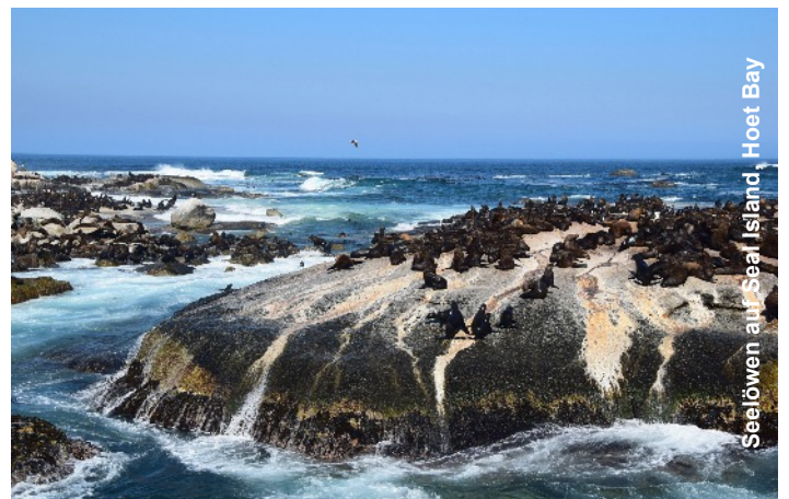
Seelöwen auf Seal Island, Hoet Bay