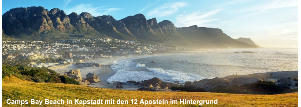
Camps Bay Beach in Kapstadt mit den 12 Aposteln im Hintergrund

Gleich nach dem Frühstück erwartet Sie Ihr Bus zur Fahrt hinaus in die