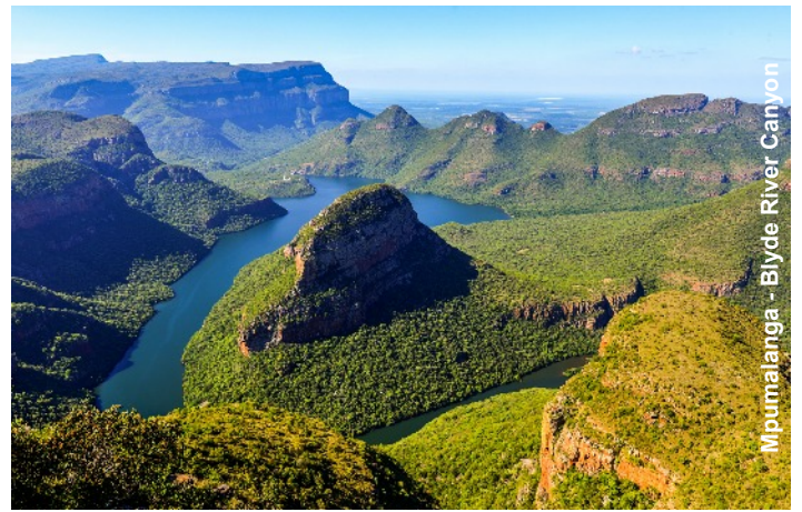
Mpumalanga - Blyde River Canyon