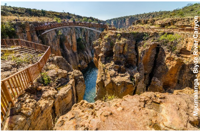
Mpumalanga - Blyde River Canyon